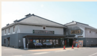
豊後高田 昭和の町